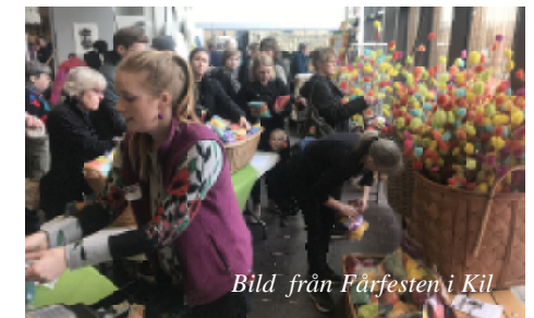
Bild från Fårfesten i Kil